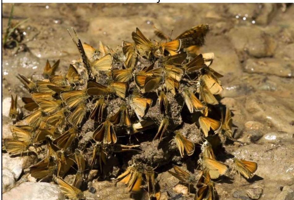
Tymelicus lineola , Hespérie du dactyle, Zwartsprietdikkopje, Saxifraga-Jan van der Straaten.